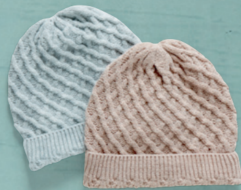
Vinter tilbehør Str. 98-140.