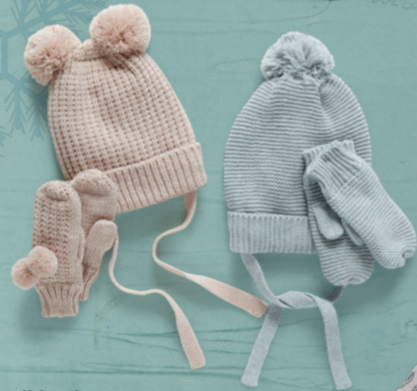
Strikket hue og vanter Str. 68-98.

FRIENDS er børnetøj, som er gennemtænkt, gennemtestet og skabt til hverdagen. En hverdag med plads til at lege, lære og opleve.